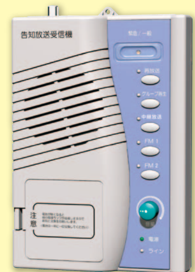
外形寸法:幅15.2cm×高さ22.0cm×奥行4.6cm

※各機関の電話機から告知放送センター装置に接続し、区域内への放送ができます。グループ放送は、区域内の各受信機へ録音されますので、グループ再生ボタンを押すことにより聞き直しができます。