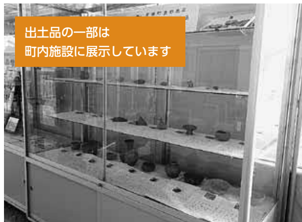
出土品の一部は 町内施設に展示しています