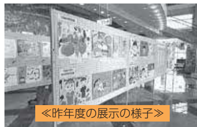
《昨年度の展示の様子》

吉備中央町栄養改善協議会では、町内の小学生を対象にした食育推進ポスター、中学生を対象に食育推進標語のコンクールを実施しました。子どもたちの食に対する感謝の気持ちや楽しい食卓など、さまざまな思いを目で見てとれる素晴らしい作品が揃っていますので、ぜひご来場ください。