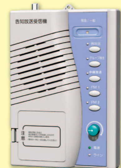
外形寸法:幅15.2cm×高さ22.0cm×奥行4.6cm

※各機関の電話機から告知放送センター装置に接続し、区域内への放送ができます。グループ放送は、区域内の各受信機へ録音されますので、グループ再生ボタンを押すことにより聞き直しができます。