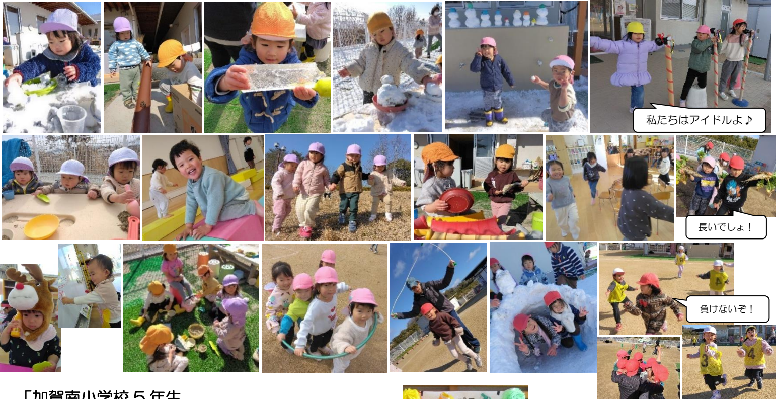
私たちはアイドルよ♪