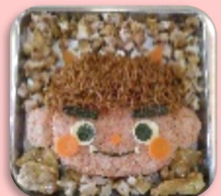
節分の行事食：オニライス