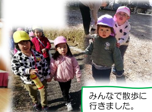
みんなで散歩に行きました。