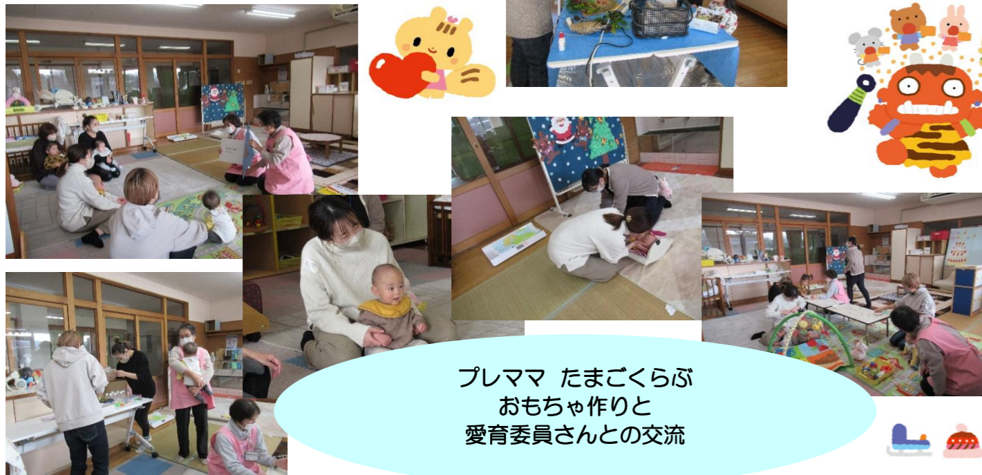
プレママ たまごくらぶ おもちゃ作りと 愛育委員さんとの交流