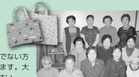
布手芸クラブのみなさん(円城公民館)

布手芸クラブのみなさんに縫っていただきました。袋をお持ちでない方にお貸しいたします。大切にお使いください。