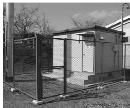
新たに設置された吉備高原環境大気測定局