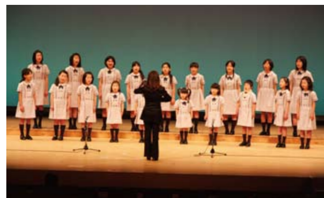
吉備中央町児童合唱団によるオープニング「コーラス」