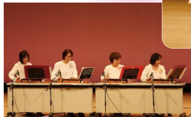
パープルロベリアによる「大正琴」