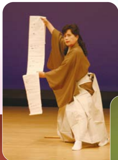
吉備中央町文化協会による「舞踊」

2日目には、レインボーホールにおいて、琴、尺八、舞踊、大正琴、銭太鼓など各団体による日頃の練習の成果が披露されました。