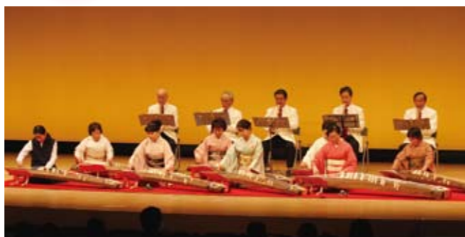
ことぶき会 賀陽支部・真竹の会による「琴・尺八の演奏」