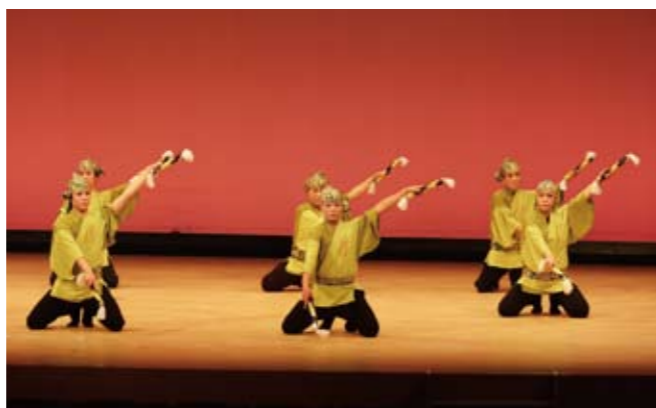
宮坂流銭太鼓保存会 賀陽支部による「銭太鼓」