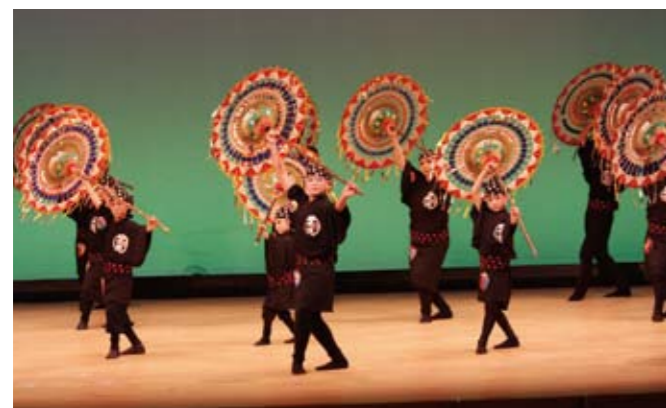
宮坂流銭太鼓保存会 賀陽支部による「傘踊り」