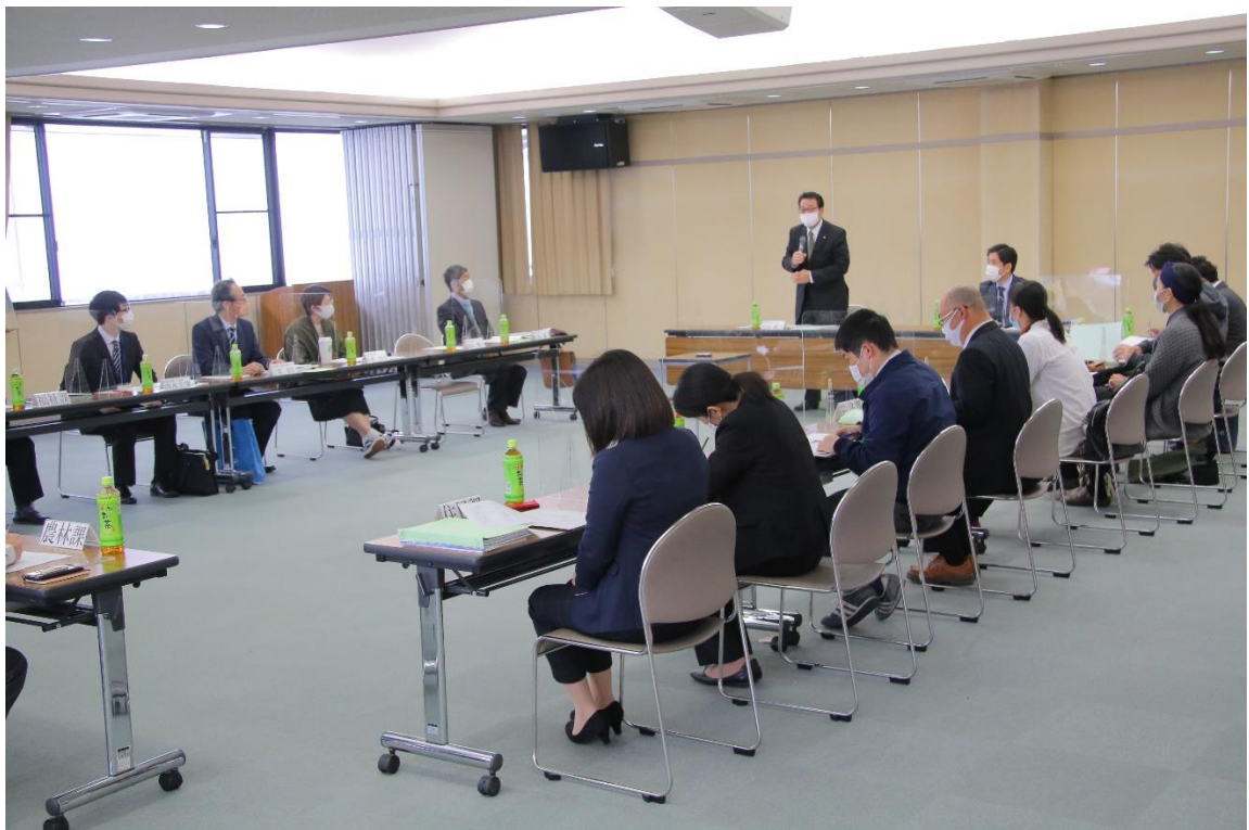
総合計画策定まちづくり会議