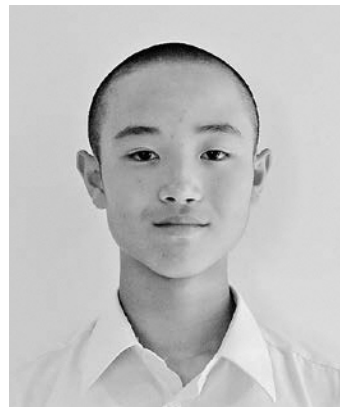
「強いぞババちゃん」