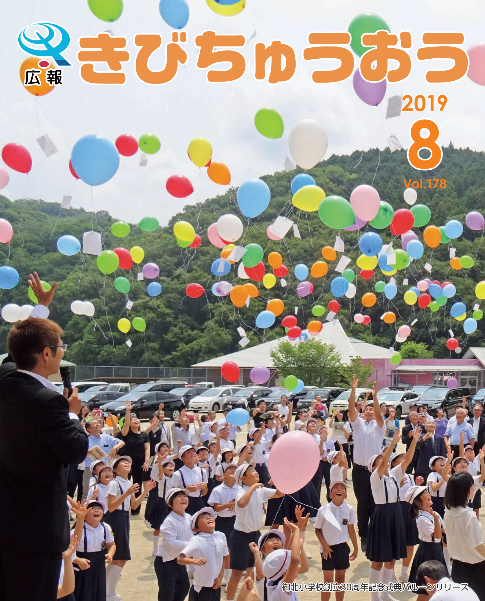
御北小学校創立30周年記念式典バルーンリリース