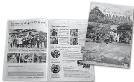
岡山ムスリムツアーガイドブック2019