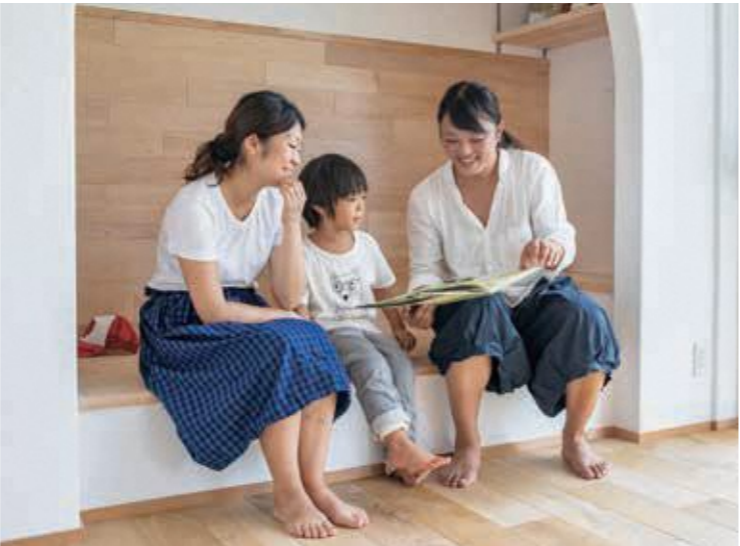
プライベートと仕事は敢えて分けられないようにされており、昼間の打合せのない時間帯はなるべく家族と過ごす時間にされ、早朝と夜間に集中して仕事をされることが多いそうです。

吉備高原都市は、今後、アクセスも格段に良くなると思いますし、土地の価格も上昇していく可能性があるため、移住するのは今がチャンスだと思います。