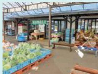
道の駅かもがわ円城