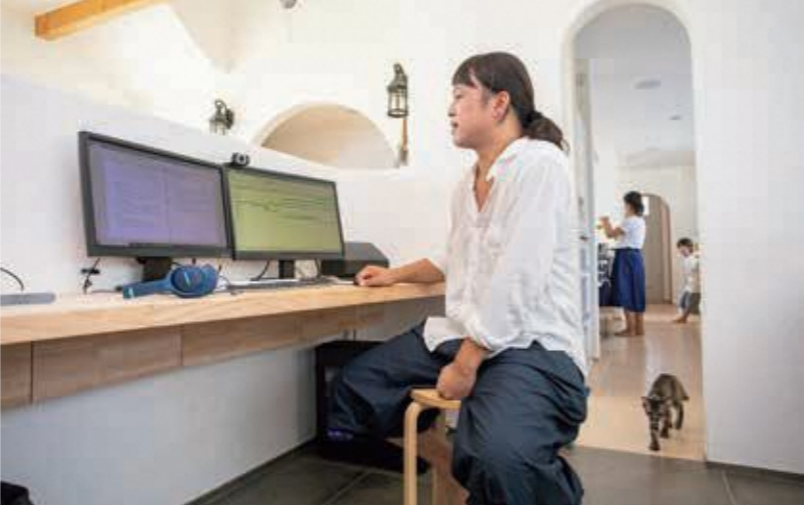
普段は自宅兼事務所にて仕事をされています。