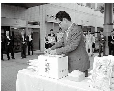
昨年多くの寄付が集まったふるさと納税米作り農家応援事業

継続事業の第3番目としては、「フジバン新工場誘致に伴う関連事業の整備」であります。新工場は平成28年春の操業開始を目指して、急ピッチで工事が進められておりますが、新年度において、町が取り組まなければならない工事としては、現在の橋梁の撤去及び新設橋の橋台等の工事、交通量の増加に伴う、交差点付近の県道の拡幅工事等であります。 そのほか、町に新たな風を起すための「地域おこし協力隊」のいっそうの充実を図るとともに、竹荘・大和の中学校跡地の活用につきましても一定の方向性を見出し、進めたいと考えております。 また、合併以来の懸案でありました「自治組織の再編」も、先日、「自治組織検討委員会」からの答申を頂きましたので、答申の柱に沿って具体的な制度設計を行いたいと考えております。