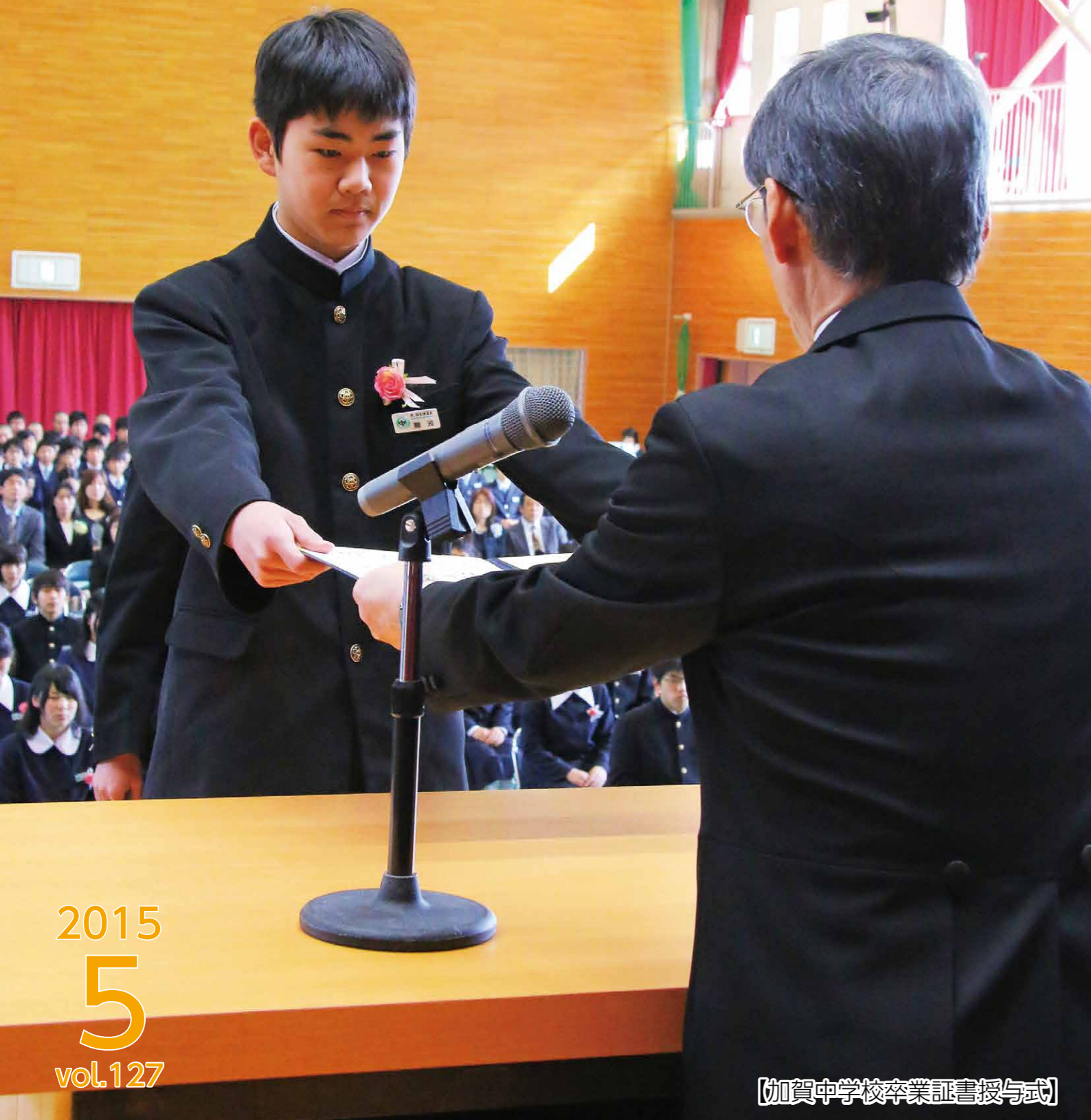
【加賀中学校卒業証書授与式】