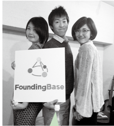
東京に住む仲間も これから月に1度来ます！