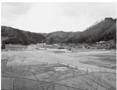
旧加茂川中学校跡地に現在整備が進むフジバン新工場

新年度は新しい時代に向けた3つの重要な計画の策定、及び既存計画の見直しに取り組む事としております。 第1は、「吉備中央町総合計画」の見直しであります。 総合計画は町の最上位計画であり、計画期間は10年で、5年毎に見直す事になっており、平成19年に策定した現在の総合計画は、平成28年度に10年目を迎える訳であります。 しかし、予想を超えた、現下の急速な少子・高齢化の進展、また国の進める地方創生等の動きに的確に対応しながら、新鮮かつ実効性のある指針とするため、当初計画を1年前倒しして、次期10年間の総合計画を策定する事といたしました。 この中では、特に国の地方創生と歩調を合わせた「人口増のための対策・地域経済の活性化」を重点に、現計画の成果の検証を行った上で、具体的な目標数値を示した計画策定を行う考えであります。 第2の計画改定は「吉備中央町過疎計画」の見直しであります。改定に当たりまして、単に従来の計画を踏襲したり、過疎債を