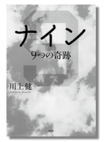
『NINE 9つの奇跡』 川上健一/著 PHP研究所

60代女性 発信! ①この本を手にとったきっかけは? かもがわ図書館で見つけた。 ②本について教えてください! 年齢、経験も問わない! 大募集によって集まったユニークな9人の草野球チーム「ジンルイズ」。仲間と楽しめればいい、勝ち負けなんてこだわらない、ガツガツしない…それもいいなあと感じがほぐれる本でした。