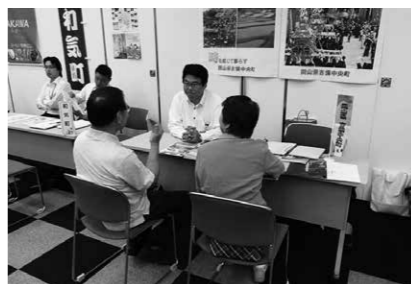
定住促進施策も引き続き取り組みます

援」、定住促進、特に「子育て世代の定住支援」や、出生数増を目指して、「安心して子どもを産み、育てやすい環境づくりや育児支援」、そして総合的な「公共交通体系の整備」を中心に、皆さんの知恵を結集して、各々の計画策定を行う必要があると考えております。